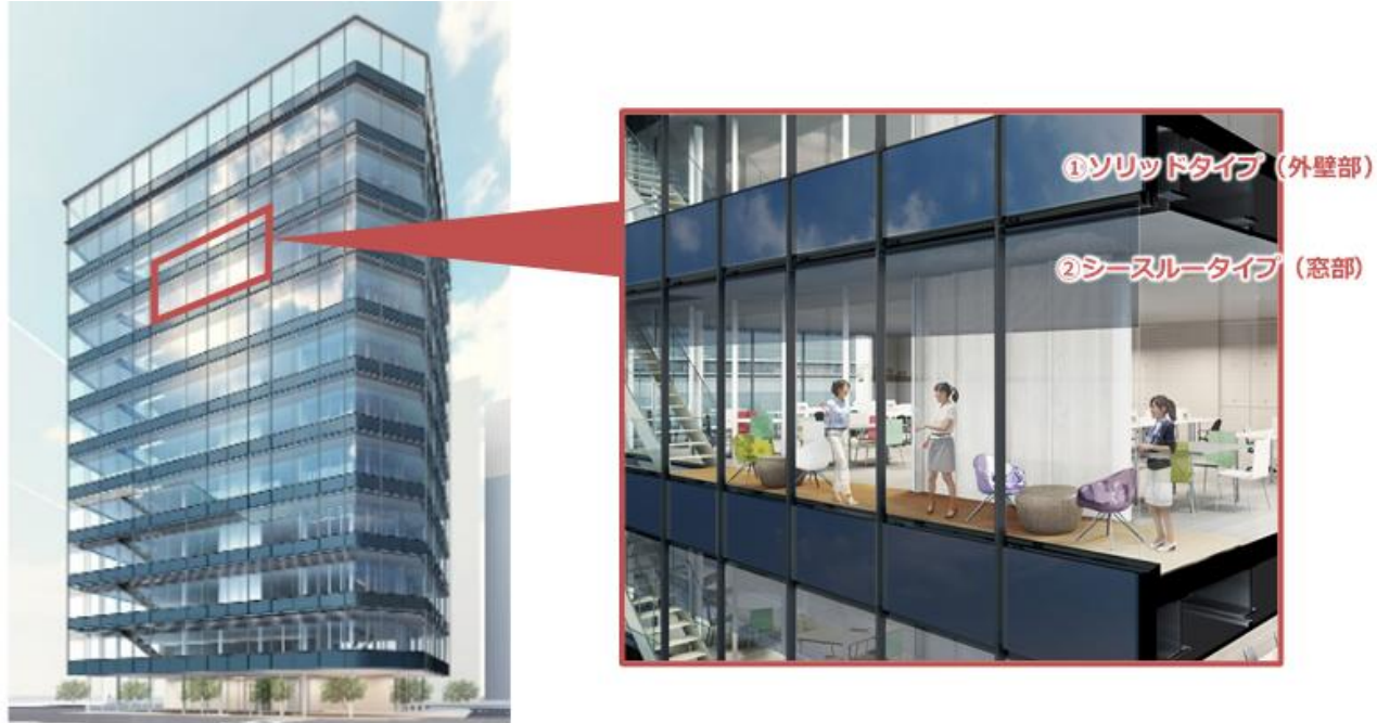
導入イメージ (中・小規模ビルの外装)